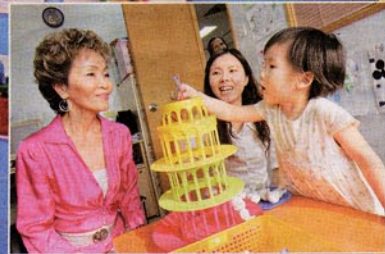
庇恩兒童中心撥出60%的服務配額幫助有財政困難的家庭, 豁免或減免他們的收費, 已有經濟困難的家庭(包括領取綜援的家庭)可在後服務前或期間提出申請。