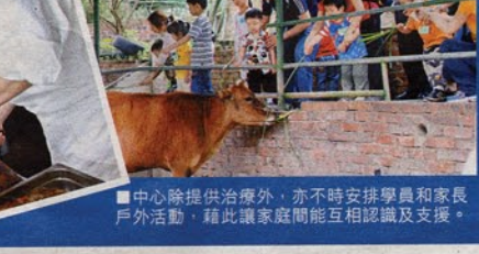
■中心除提供治療外，亦不時安排學員和家長戶外活動，藉此讓家庭間能互相認識及支援。

據統計，在05/06學年，本港患有語言障礙的學童約有8000人，而去年衛生署接收的語言障礙個案共2400個。由於供不應求，患者一般需要輪候半年方能接受政府的語言治療評估，至於排期接受語言治療的時間甚至長達兩至三年。