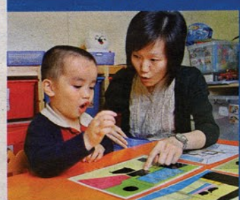
■一對一的語言治療，可有效改善語言障礙的兒童。

會，籌募擴建的經費。他們希望將中心現有規模擴大一倍，令輪候表上的兒童可更快得到適切的治療之餘，也是為患有語言障礙兒童的父母提供輔導服務。「我們也是過來人，很明白這些家長要照顧特殊需要兒童的困難，何況部分家庭還可能面對經濟問題，部分甚至要照顧不止一個有特殊需要的孩子。我們希望透過中心與他們分擔壓力，分享經驗。不過說到底，長遠來說也希望可以提高政府對語言障礙兒童的關注，讓有需要的兒童得到更長時期的幫助。」